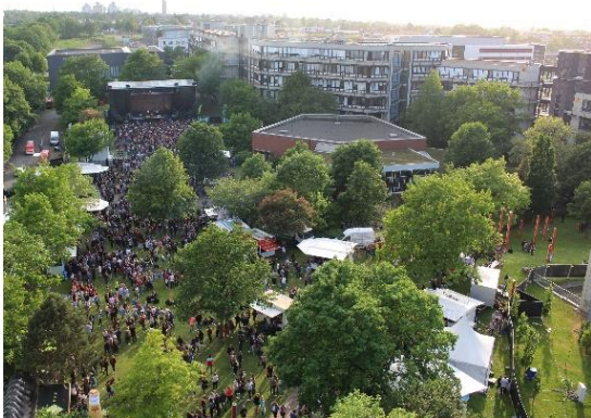
Impressionen vom AStA-Sommerfestival