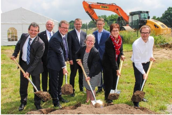
Erster Spatenstich und Richtfest des ILH-Gebäudes