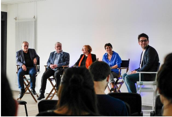
Talkrunde im AStA-Stadtcampus

Besonders erfreulich ist nicht nur das wachsende Interesse der Studierenden an der Universität Paderborn, sondern auch das studentische Engagement, das sich im vergangenen Jahr erneut in zahlreichen Aktivitäten und Veranstaltungen eindrucksvoll niederschlug. So wurde beispielsweise am 14. April, dem Tag des International March for Science, im AStA-Stadtcampus eine Talkrunde veranstaltet, in der darüber diskutiert wurde, warum Menschen wieder an eine flache Erde glauben, Medien mit Fake News aufwarten, die Wissenschaft als Gegner und Teil einer Verschwörung sehen, aber vor allem, warum die Freiheit der Wissenschaft ein hohes Gut ist.