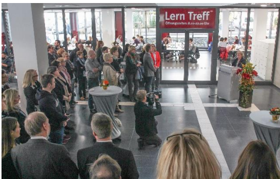
Einweihung Gebäude I und Blick auf die Bibliotheksräume

Zudem ist das Lern- und Bibliotheksgebäude I fertig gestellt worden, in dessen fünf Geschossen mit 3.370 Quadratmetern Nutzfläche die Studierenden nunmehr optimale Arbeits- und Lernbedingungen vorfinden und diese auch erkennbar nutzen.